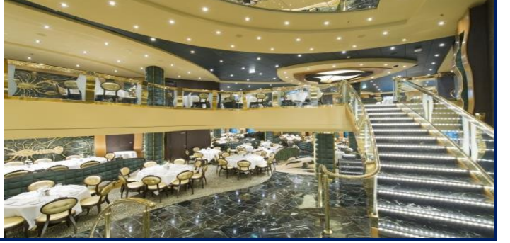
GOLDEN LOBSTER RESTORAN